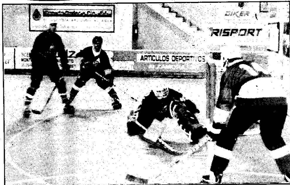
El hockey en línea es el deporte con mayor crecimiento en España